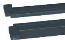
Válec uvnitř základny