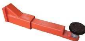
Teleskopické rovné rameno