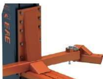
Zadní zvedací rameno